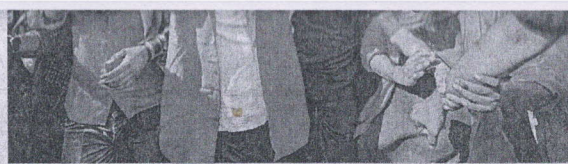
नई दिल्ली में गुरुवार को आनंद विहार रेलवे स्टेशन पहुंचे कांग्रेस के वरिष्ठ नेता राहुल गांधी कुली के रूप में दिखे। वह यहां कुलियों से भेंट करने पहुंचे थे। इसी दौरान उन्होंने कुलियों की वंदी पहनकर सिर पर ट्राली बैग भी उठाया

राहुल गांधी सुबह करीब साढ़े सात बजे स्टेशन पहुंचे। उस वक्त कुली जीआरपी थाने के पास रोजाना की तरह नंबर लगाकर यात्रियों का इंतजार कर रहे थे। उनके पहुंचते ही सभी कुली एक जगह इकट्ठा हो गए। वहीं, सामान देने वाली ठेली पर बैठ कर राहुल ने कुलियों की समस्याएं सुनीं। कुलियों ने उन्हें बताया कि इस स्टेशन पर 165 कुली हैं। इतने कुलियों के लिए छोटे